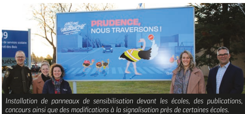
Installation de panneaux de sensibilisation devant les écoles, des publications, concours ainsi que des modifications à la signalisation près de certaines écoles.

La sécurité des élèves est une préoccupation partagée par les parents, le Centre de services scolaire et ses partenaires. Ainsi, le CSSOB s'est joint au Collectif 117 et à la campagne «Fais pas l'autruche» afin de sensibiliser les automobilistes à adopter des comportements vigilants près des écoles, des centres de formation et des autobus scolaires. Plusieurs actions ont aussi été mises en place.